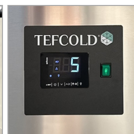
Digitální řídicí jednotka