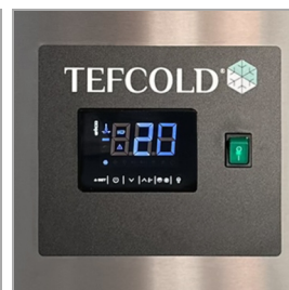
Digitální řídicí jednotka