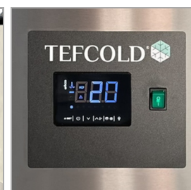
Digitální řídicí jednotka