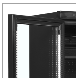
Éclairage LED dans le cadre de la porte