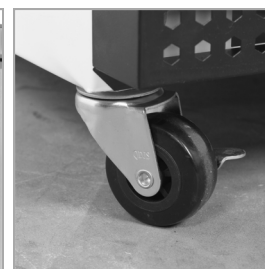
Pevná kolečka jako volitelné příslušenství