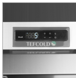
Digitální ukazatel teploty