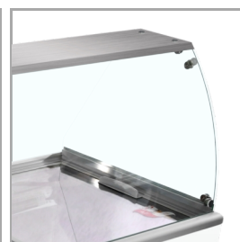
Gebogen glas voor mooie presentatie