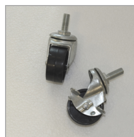
Ruedas giratorias resistentes