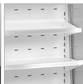
Estantes ajustables con función inclinación