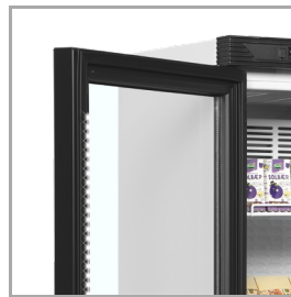
Oświetlenie LED wewnątrz obramowania drzwiczek

Produkty z serii CEV są dostępne w wersjach białej lub czarnej, z drzwiami otwieranymi na prawą lub lewą stronę oraz z okapem lub bez. Na życzenie i za dodatkową opłatą produkt jest również dostępny z unijną klasą energetyczną C. Aby uzyskać więcej informacji, skontaktuj się z naszym zespołem sprzedaży.