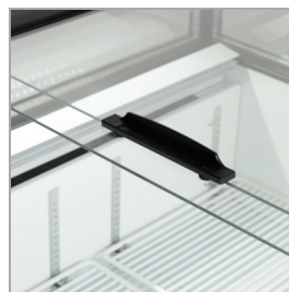
Przesuwne pokrywy szklane