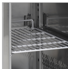
Półki GN 1/1