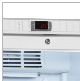
Termostato con alarma acústica y externa