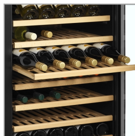
Estantes de madera extraíbles