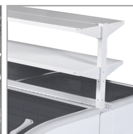
Półki promocyjne (jako wyposażenie dodatkowe)