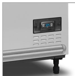
Digitální ukazatel teploty