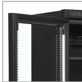
LED osvětlení v rámu dveří