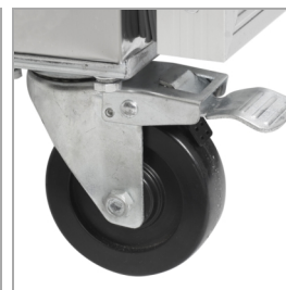
Pevná kolečka jako volitelné příslušenství