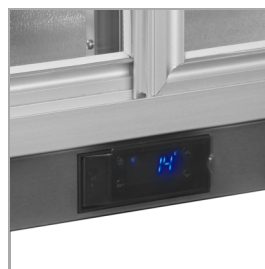
Skyddshölje på termostat