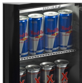
Przeznaczona na napoje energetyczne w