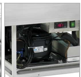
Automatische Verdunstung von Abtauwasser