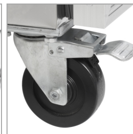
Pevná kolečka jako volitelné příslušenství