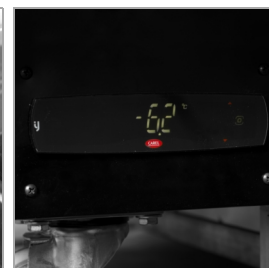
Digitální řídicí jednotka