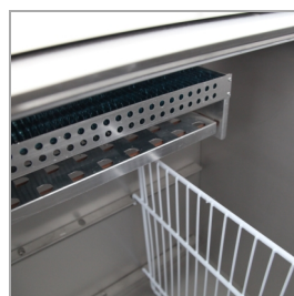
Système de cloisons