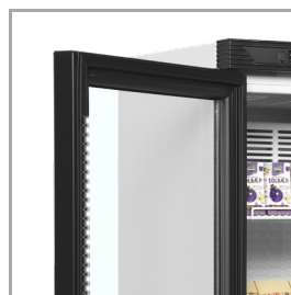
Éclairage LED dans le cadre de la porte