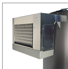
Monobloková zadní strana – bez připojení k panelu