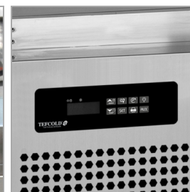
Wstępnie zaprogramowany termostat