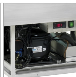
Automatische verdamping van dooiwater