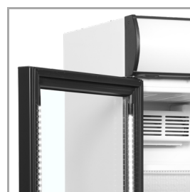
Éclairage LED dans le cadre de la porte