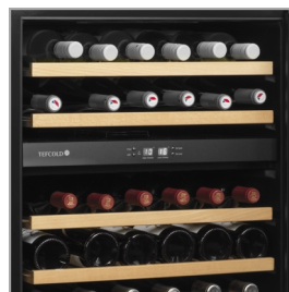
Estantes de madera extraíbles