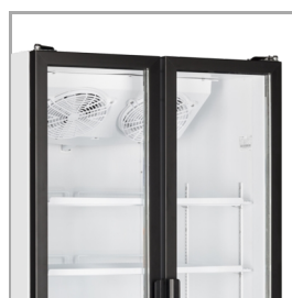
Drzwi na całą wysokość