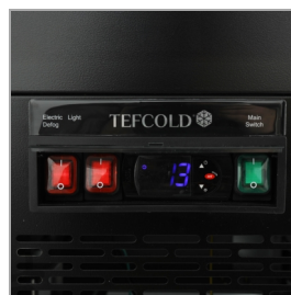
Digitální ukazatel teploty