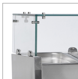
Glasaufbau zum Schutz von Lebensmitteln