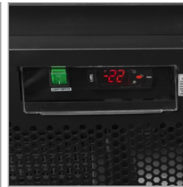
Digitální řídicí jednotka