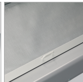
Cortina nocturna trasera para mantener la temperatura