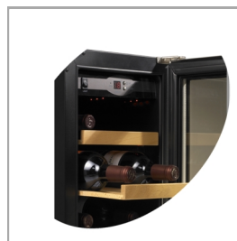
Tablettes à tiroir en bois