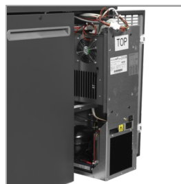
odnímatelná chladicí jednotka pro snadnou údržbu