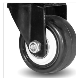
Ruedas giratorias resistentes