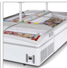
Instalación en isla, estantes como accesorio