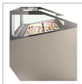
Paredes de cristal como estándar