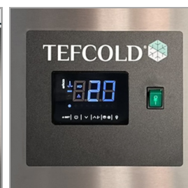
Digitální řídicí jednotka