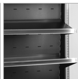
Estantes ajustables con función inclinación