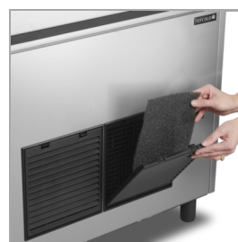
Filtre de condenseur facile à nettoyer