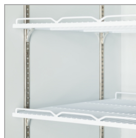
Estantes ajustables detrás de cada puerta