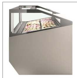
Szklane ściany boczne w standardzie