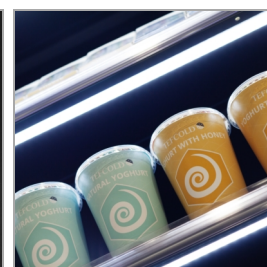
Luz LED debajo de todos los estantes