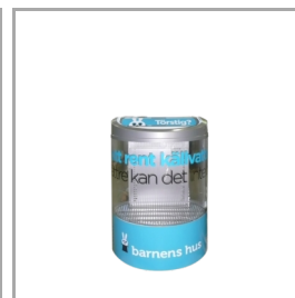
Convient aux graphiques