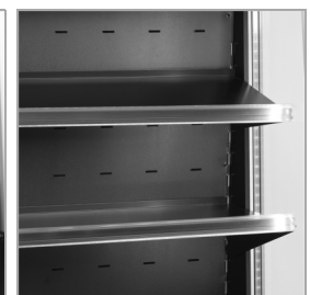
Verstellbare Roste mit Kippfunktion