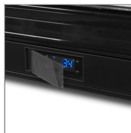
Ochranný kryt na termostat