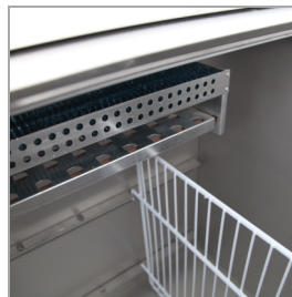
Système de cloisons